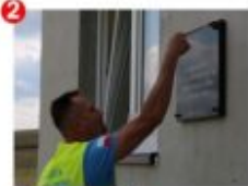
2 Caców Tablica poświęcona pamięci bitwy Brygady Świętokrzyskiej NSZ z Niemcami pod Cacowem 20 września 1944.