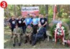
3 Lasocin Pomnik pamięci dowódców i żołnierzy Brygady Świętokrzyskiej NSZ powołanej 11 sierpnia 1994 roku w Lasocinie